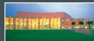
| Forum am Schlosspark