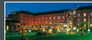
| Hotel Nestor